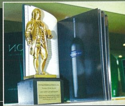
▲ 獲《金人獎》的作品 Icon。