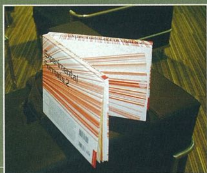
▲ 榮獲大獎 Award of Recognition 的 Experimental Formats 2。