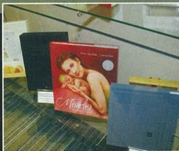
▲ 榮獲 Award of Recognition 大獎的圖書 Miracle。