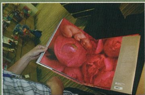
▲ 此書獨特的設計可把 CD 存於玫瑰花內。