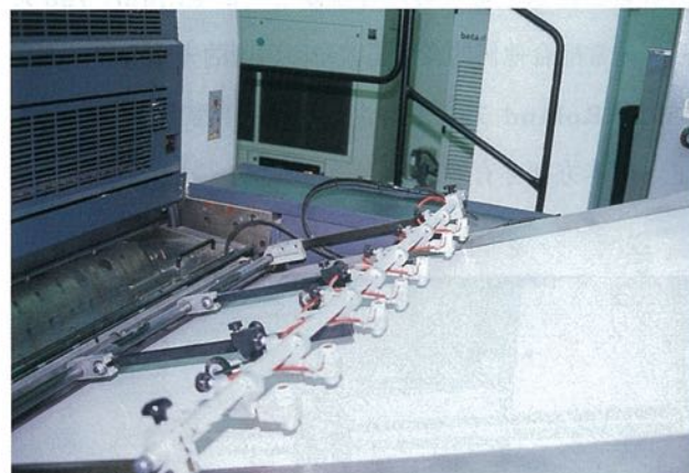
R706 LTTLV 在送紙台上的防靜電裝置