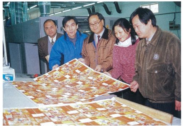
檢視印刷成品，效果出色

印刷廠管理亦得以改善。公司定下時間表，希望能在兩至四年內成為上市公司。到時一方面公司的根基打穩了，一方面可以在市場吸納資金，加強向外發展。相信憑著他們的堅毅精神，一定可以達到目標。