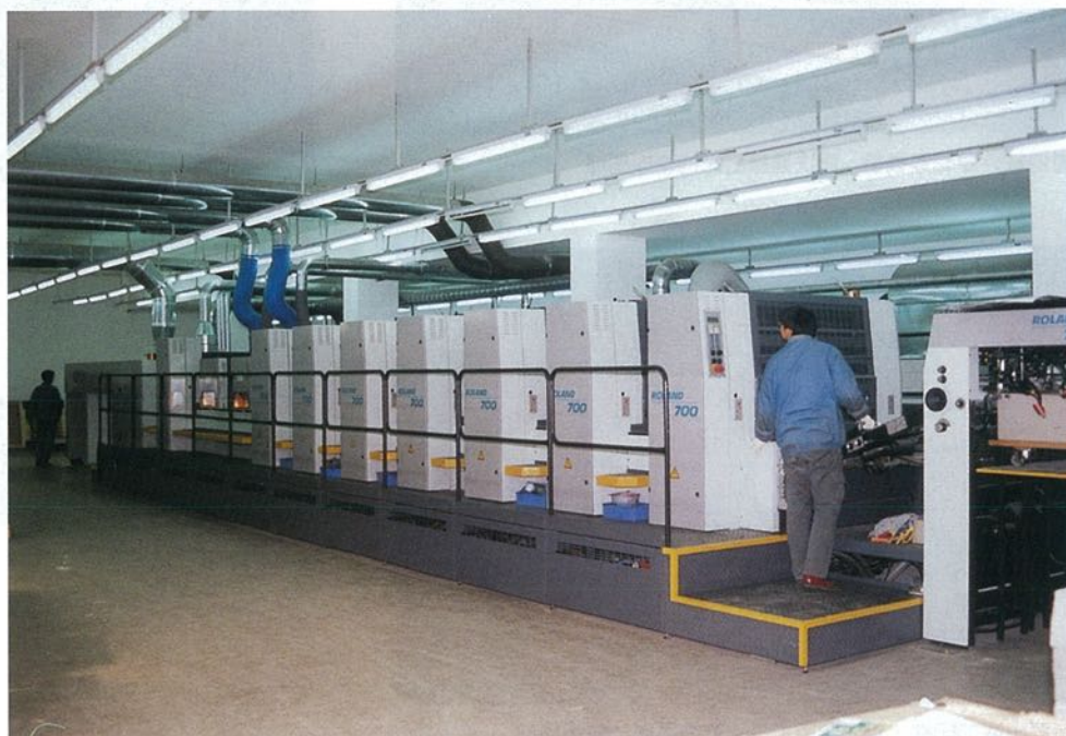
曼羅蘭公司的R706 LTTLV六色連線上光加紅外線及紫外光乾燥印刷機