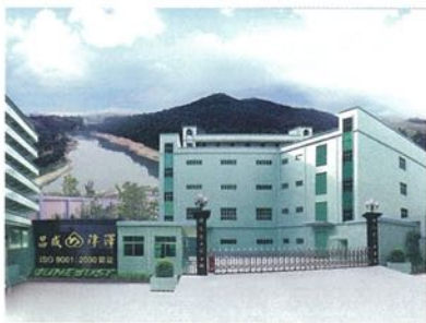
津澤有限公司國內廠房

有人說印刷市場飽和，我認為這是因為某些印刷廠的品質或技術管理得不好，未能達到客戶的要求。我相信印刷市場潛力巨大。