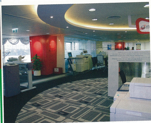
知識管理交流中心一角。

觀為慶祝該公司四十週年而新開設的知識管理交流中心，該中心引進了多項嶄新設施和技術，陳列了富士施樂(香港)有限公司全線產品及解決方案，能夠為客戶帶來一站式的完善服務。