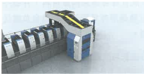
发往Amcor烟草包装公司的高宝利必达106的VinfoilInfigo