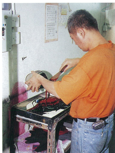
配色是印刷牌仔的重要一環。