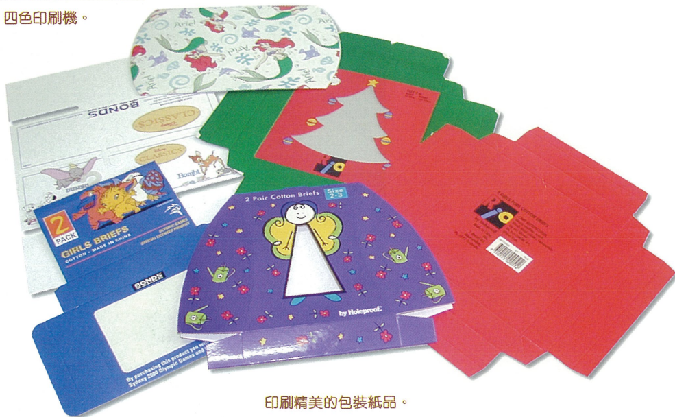
印刷精美的包裝紙品。