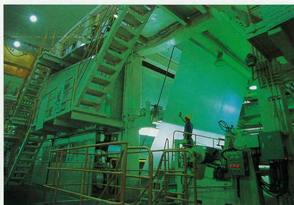
Hansol的其中一個造紙工場Taejon Mill