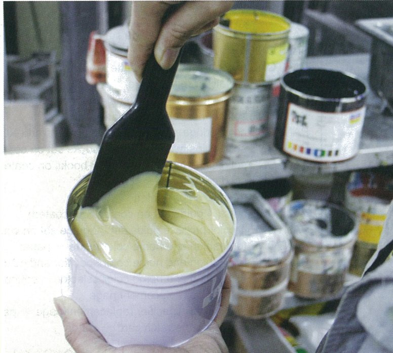
香味光油加入墨斗前，必須攪勻，避免小香囊沉澱在罐底，影響香味效果。