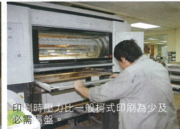
印刷時壓力比一般柯式印刷為少及必需隔盤。