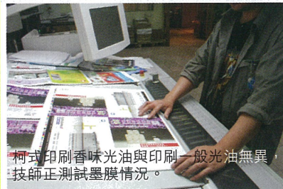
柯式印刷香味光油與印刷一般光油無異，技師正測試墨膜情況。