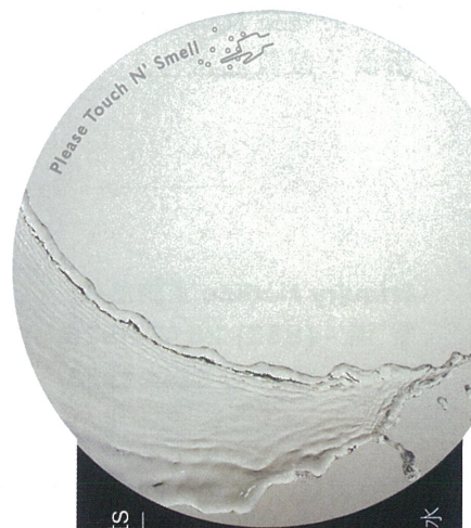
Che San Printing Scents TOUCH'N SMELL