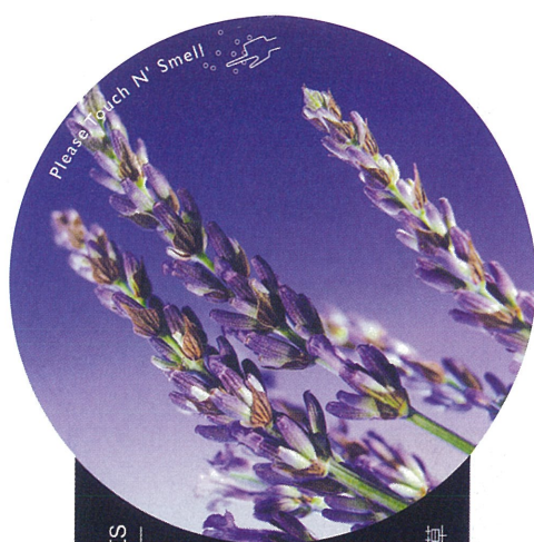
Che San Printing Scents TOUCH'N SMELL