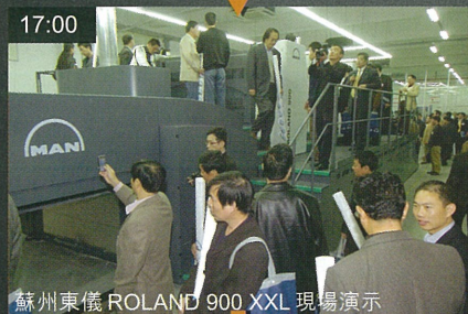
蘇州東儀 ROLAND 900 XXL 現場演示