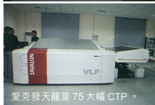
愛克發天龍星 75 大幅 CTP。