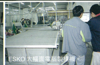
ESKO 大幅面電腦製樣機。