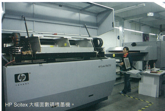
HP Scitex 大幅面數碼噴墨機。