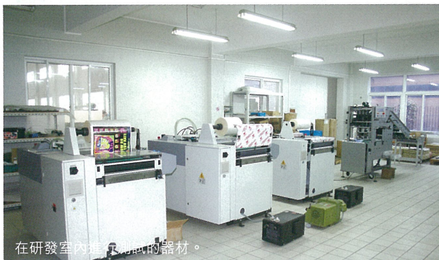
在研發室內進行測試的器材。